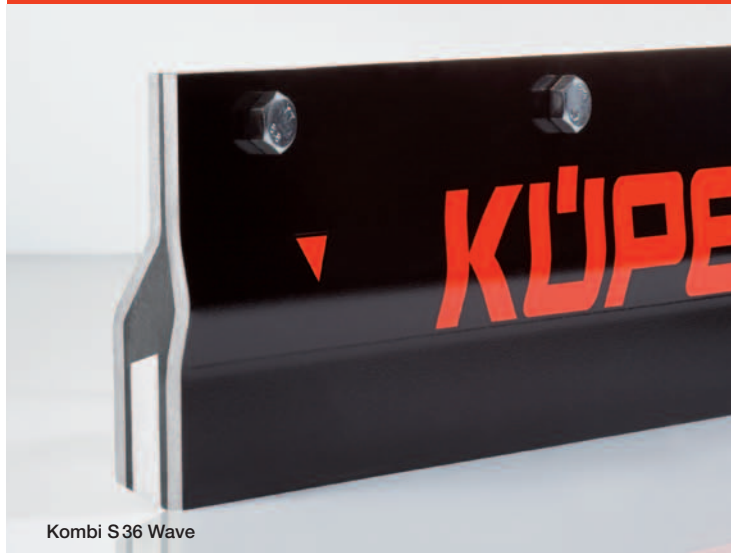
Kombi S36 Wave