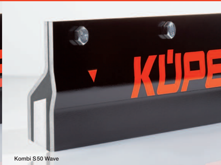
Kombi S50 Wave